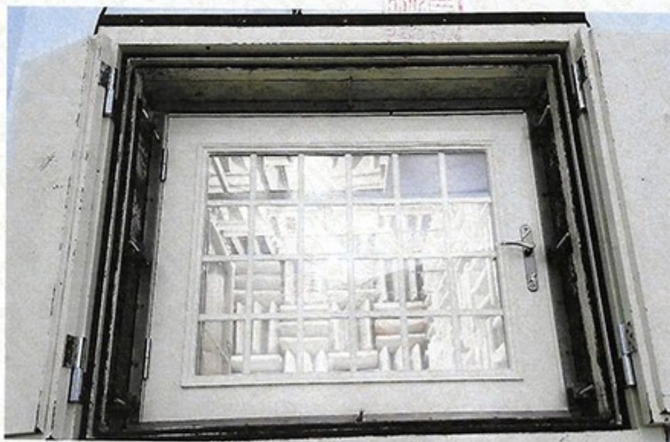
圖 2 試樣佈置圖 (迴響室)