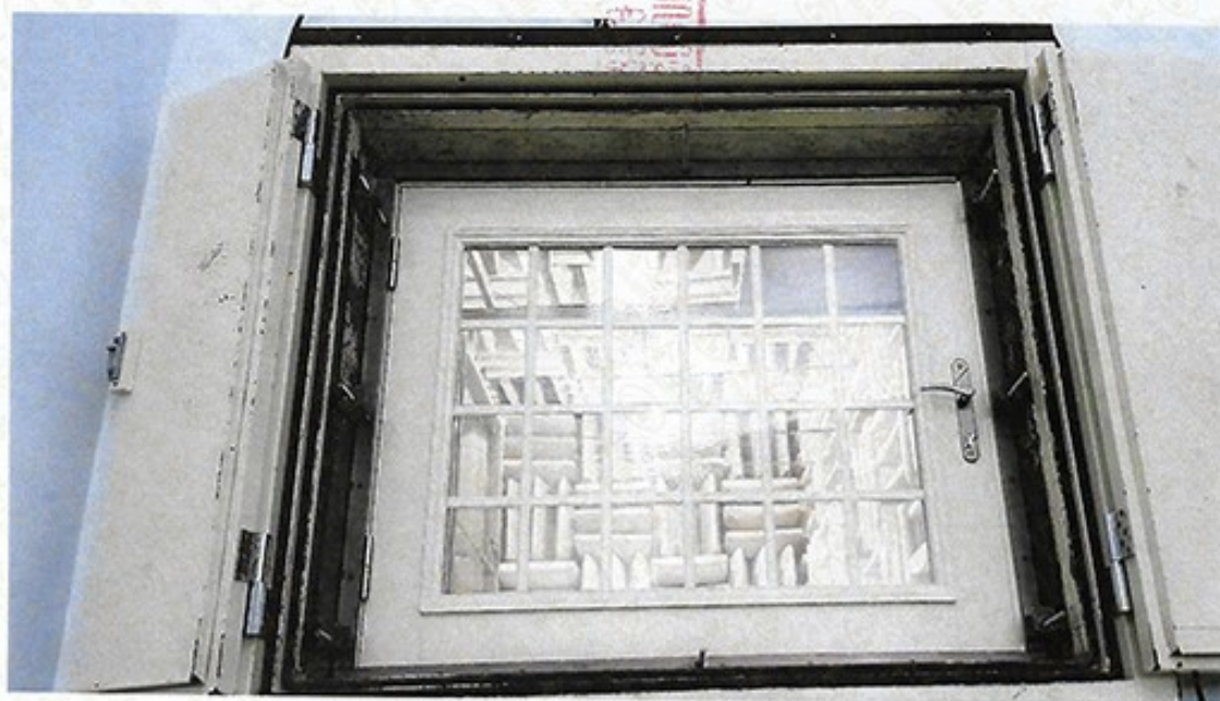
圖 2 試樣佈置圖 (迴響室)