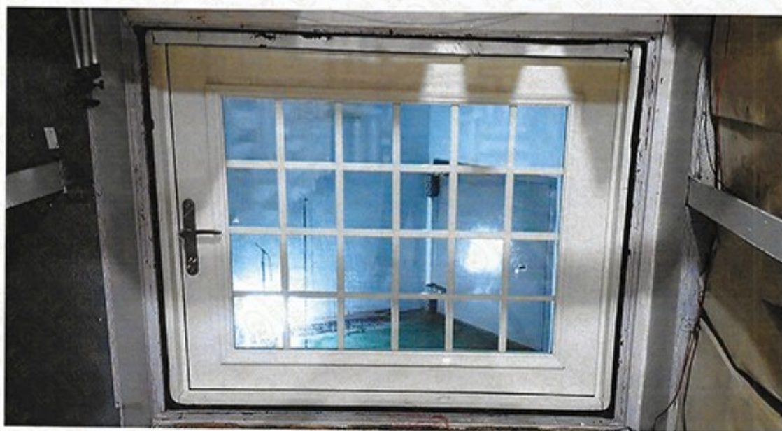
圖 1 試樣佈置圖 (無響室)