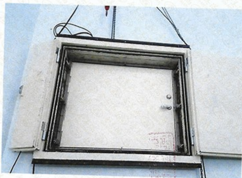
圖 2 試樣佈置圖 (迴響室)