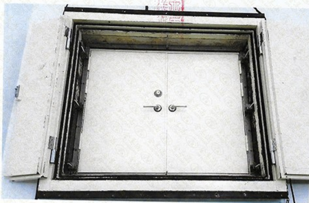
圖 2 試樣佈置圖 (迴響室)