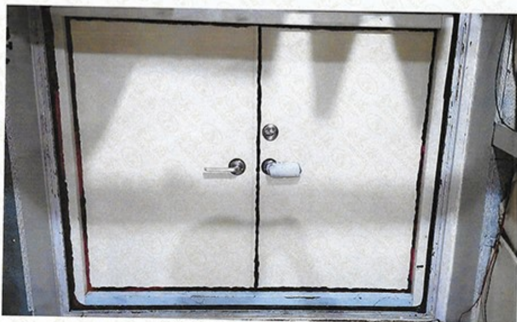
圖 1 試樣佈置圖 (無響室)