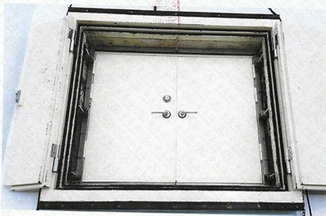
圖 2 試樣佈置圖 (迴響室)