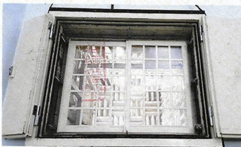
圖 2 試樣佈置圖 (迴響室)