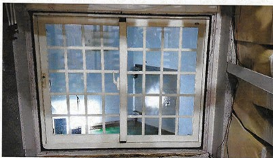
圖 1 試樣佈置圖 (無響室)