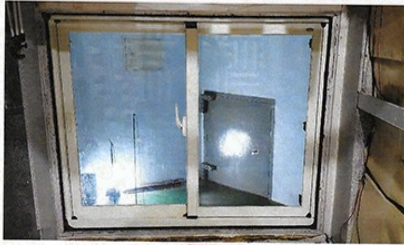
圖 1 試樣佈置圖 (無響室)