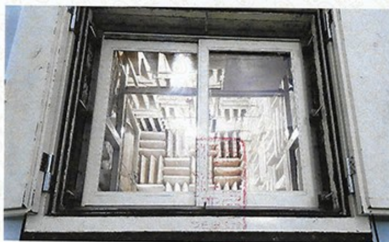
圖 2 試樣佈置圖 (迴響室)