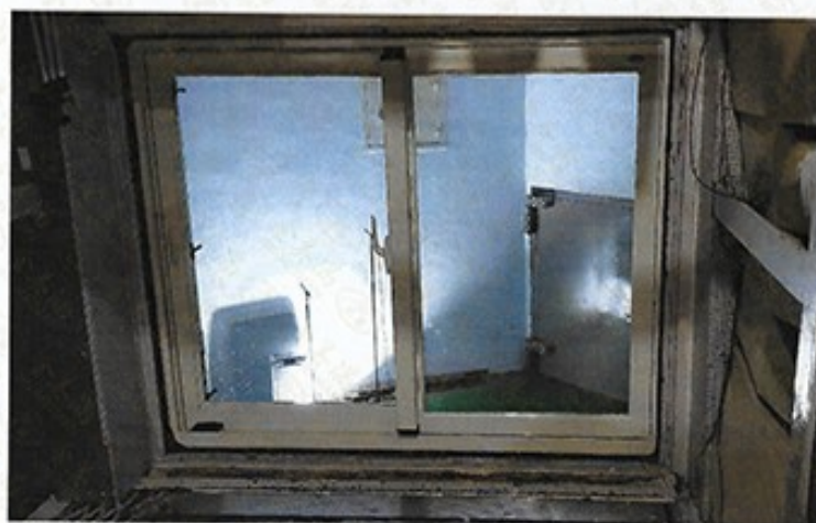
圖 1 試樣佈置圖 (無響室)