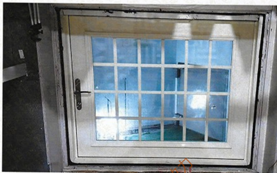
圖 1 試樣佈置圖 (迴響室)