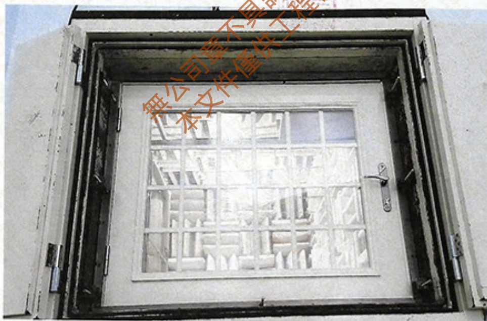
圖 2 試樣佈置圖 (迴響室)