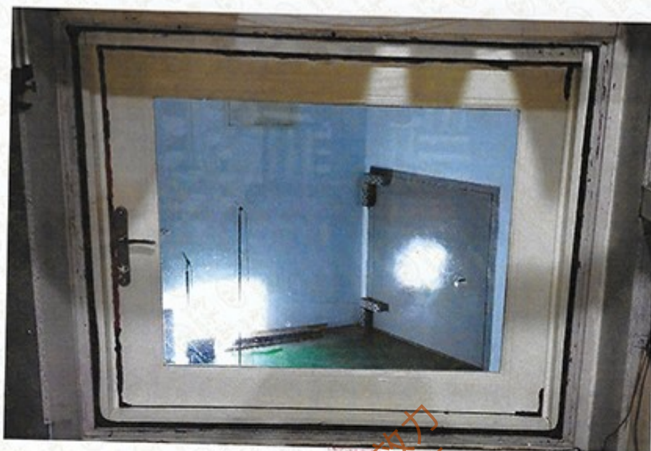
圖 1 試樣佈置圖