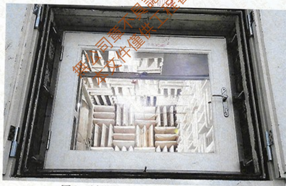
圖 2 試樣佈置圖 (迴響室)