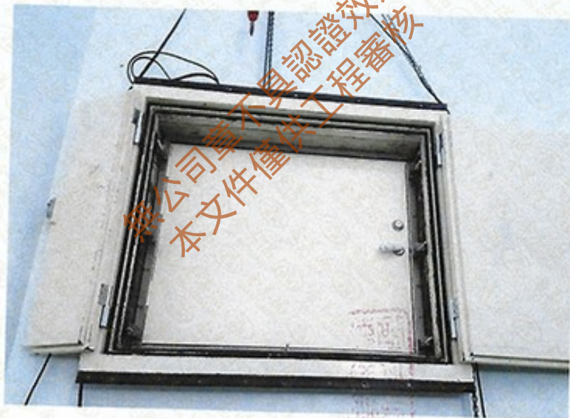
圖 2 試樣佈置圖 (迴響室)