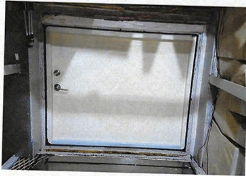
圖 1 試樣佈置圖 (無響室)