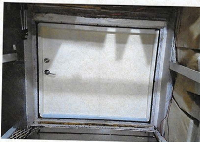
圖 1 試樣佈置圖 (無響室)