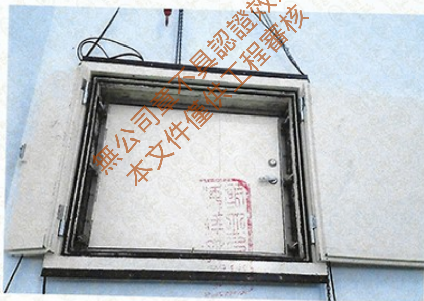
圖 2 試樣佈置圖 (迴響室)