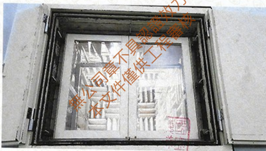
圖 2 試樣佈置圖 (迴響室)