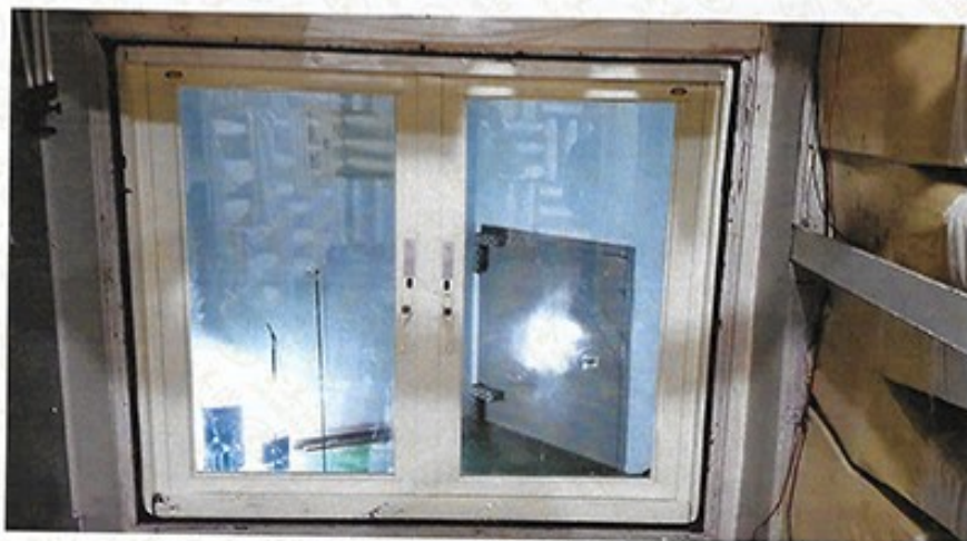
圖 1 試樣佈置圖 (無響室)